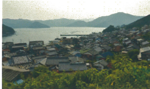
スケッチ場所：三木浦