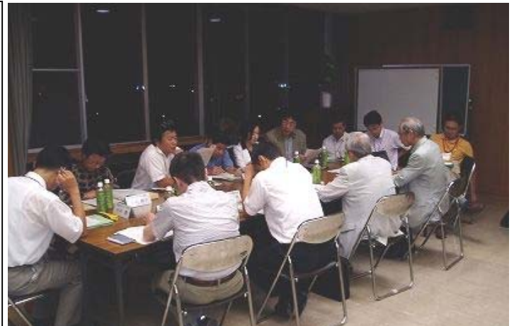
▲統一イメージ戦略分科会の開催風景

第1回目分科会では、事務局より分科会での作業内容等を説明し、地域の課題や方向性等について活発な意見交換を行いました。