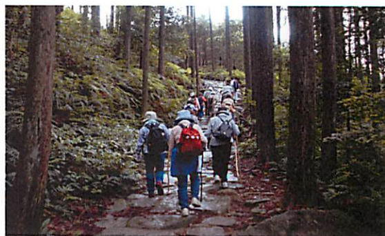
◎ 熊野古道 馬越峠

山 紀北町には、世界遺産に登録された峠が5つあります。（馬越峠・始神峠・ツツラト峠・荷坂峠・熊谷道）馬越峠山頂より登る、便石山の眺望は最高です！！