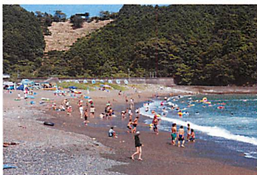
◎ 古里海水浴場（7月13日 海開き） ◎ 磯遊び

ごこまでも続く透明度の高い海と青い空をご家族で体感しませんか！（ぜひ、子供たちにきれいな海を見せてあげてください。）紀北町にはこの他にも、和具の浜海水浴場・比幾海岸海水浴場・黒浜海水浴場などがあります。