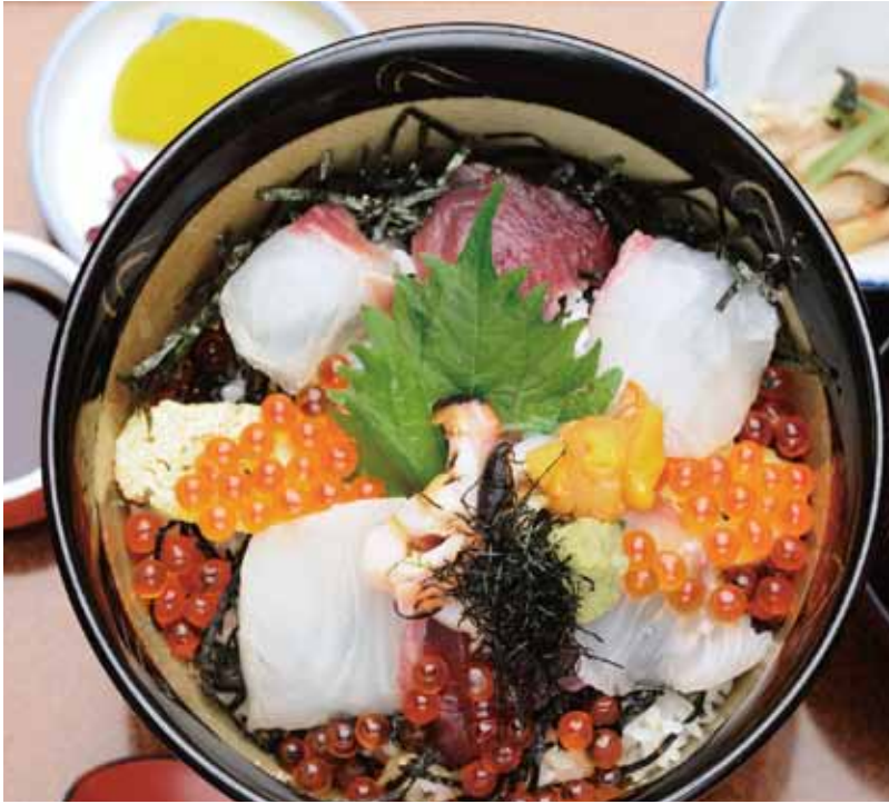
天然真鯛、カンパチ、サザエなどの地魚をはじめ色とりどりの海の幸が味わえる海鮮丼1800円。

国道42号沿い、道の駅マンボウの向かいにある海鮮レストラン。魚屋の店先には、さばかれたばかりの魚が干物網に整然と並び太陽の光を受けている。併設の喫茶店からはコーヒーの香りがたたよう。