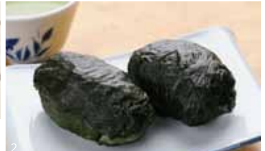
2. 昔は野良仕事の弁当だったためめはり寿司、ご飯を高菜漬で巻いたもの。ピリっとした辛みが食欲をそそる。今はお酒の後のしめに人気。3個で500円。

さんま寿司500円 岩清水豚トンカツ定食1200円 刺身定食1100円 小アジの南蛮漬600円 シイラ真子の煮つけ600円 本日のお刺身盛り合わせ1100円