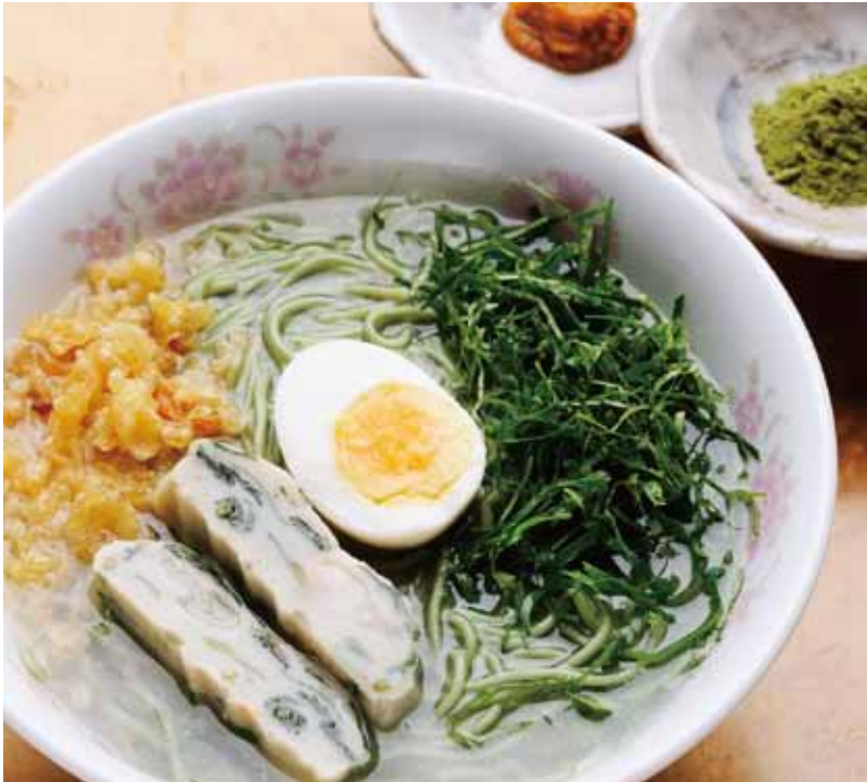
明日葉はんぺんときざみ明日葉のつた明日葉入り古道らーめん600円。明日葉パウダーと自家製ユズ唐辛子をお好みで。