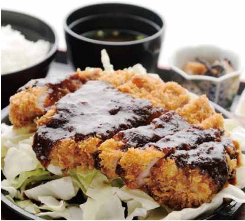
ジュージューと熱々の鉄板の上ででてくる味噌カツ定食1100円。

熊野古道伊勢路・馬越峠から下りてきた道と尾鷲駅からの道が交わるあたりにセルフはある。創業して40年以上経つ、尾鷲では老舗の喫茶店。アイスクリーム・かき水でなじみの深い店だ。