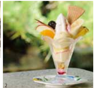
2. セルフ伝統のパフェも健在。フルーツパフェ800円。

昼/日替り弁当650円(平日のみ) 昼・夜/天ざるうどん950円、かき氷450円、フルーツみつ豆550円 夜/寿司1人前850円