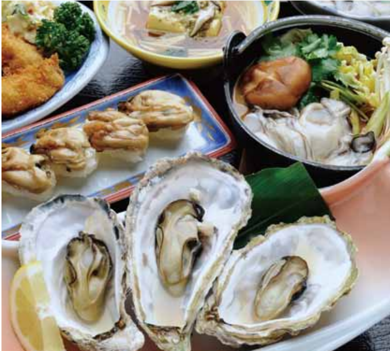
焼きカキ、カキフライ、カキの握り…新鮮なカキが惜しみなく使われている渡利カキのフルコース4200円(冬季限定・要予約)

白石湖のほど近く、総構造りの建物。カウンターには厚さ12cmもある尾鷲檜の一枚板を使用。壁には樹齢780年の神宮杉の板がはめ込まれ、重厚な木の香りが漂う寿司と割烹の店。