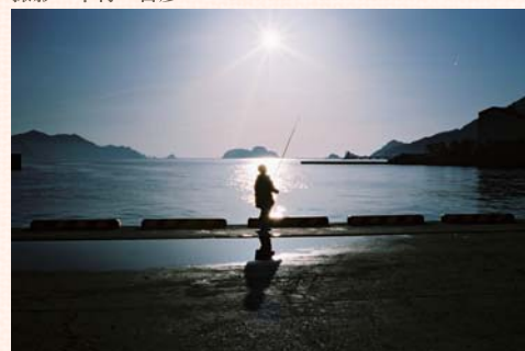
市制施行 50 周年記念「尾鷲の四季フォトコンテスト」 春の部：最優秀賞「春の海」

平成 26 年 1 月 1 日～平成 27 年 1 月 15 日の期間に 尾鷲市内で撮影された未発表の作品に限ります。