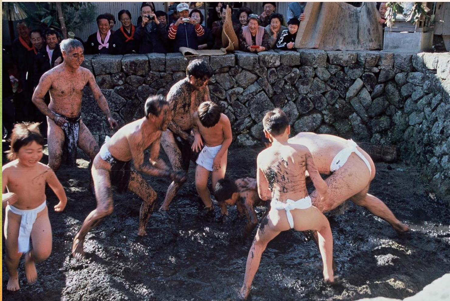
市制施行 50 周年記念「尾鷲の四季フォトコンテスト」 総合グランプリ賞&冬の部：最優秀賞「ニラクラ祭り」