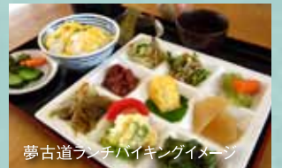
夢古道ランチバイキングイメージ