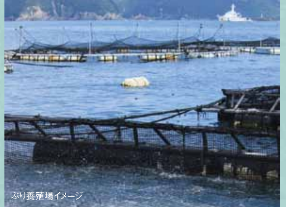
ぶり養殖場イメージ